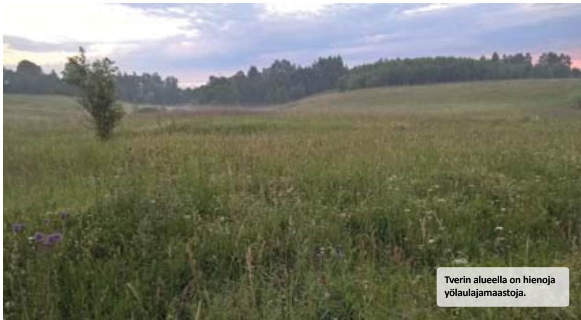
Tverin alueella on hienoja yölaulajamaastoja.

merkiksi valkopäätiaista koitettiin etsiä kovasti. Laji esiintyy jo tällä seudulla, mutta me vedimme vesiperän. Suomen mittakaavassa pikkukivoja lajeja kuitenkin kirjattiin havikseen koko ajan, kuten kymmenittäin kuhankettäjä, runsain määrin pähkinänakkeleita ja viitataisia, joitakin valkoselkätikkoja ja nokkavarpu-