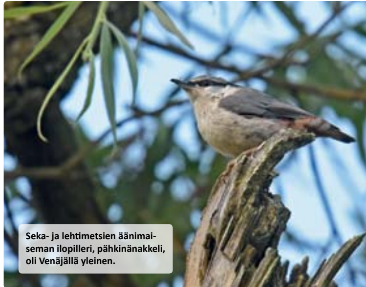
Seka- ja lehtimetsien äänimai-seman ilopilleri, pähkinänakkeli, oli Venäjällä yleinen.