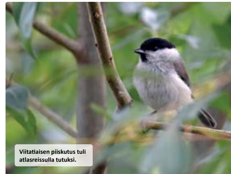
Viitataisen piiskutus tuli atlasreissulla tutuksi.