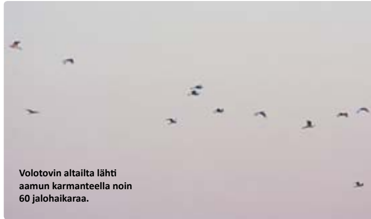
Volotovin altaalta lähti aamun karmanteella noin 60 jalohaikaraa.

Keli oli lähes koko reissun ajan hyvin kesäinen, lämpötilan kautessa enimmillään +30 °C pa-