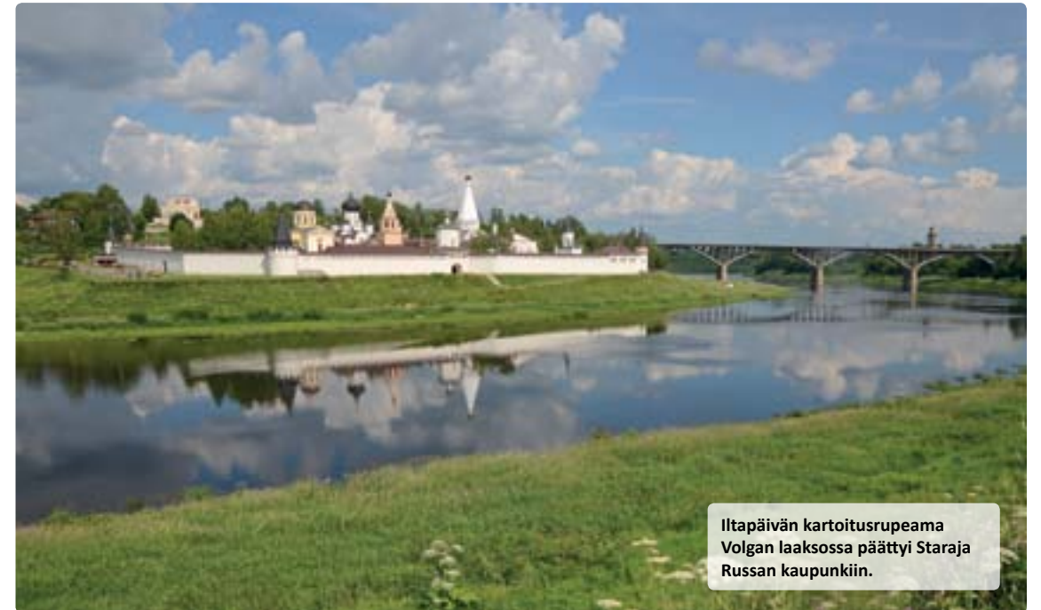
Iltapäivän kartoitusrupeama Volgan laaksossa päättyi Staraja Russan kaupunkiin.

Seuraavan retkipäivän atlastelimme Tverin eteläpuolella, mm. Redkinon pikkukaupungin lähistöllä olevilla kosteikoilla ja keinotekoisilla järvillä sekä Volgasta sivuavan Lama-joen laajentumaaltaalla. Mitään uutta ja ihmeellistä ei vastaan tullut, vaikka esi-