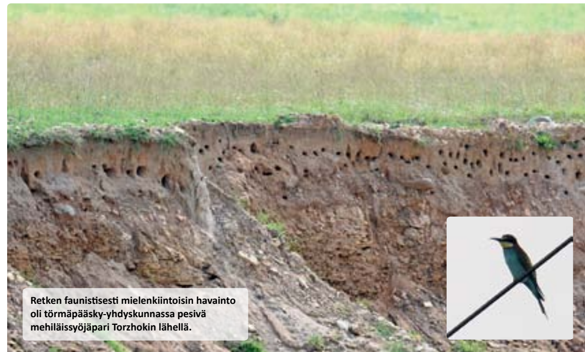
Retken faunistisesti mielenkiintoisin havainto oli törmäpääsky-yhdyskunnassa pesivä mehiläissyöjäpari Torzhokin lähellä.

Yöksi hakeuduimme paikalliseen hotelliin, josta muutaman tunnin unien jälkeen lähdimme aamuyöllä ajelemaan maaseutua edelleen etelään. Alueella on paljon entistä viljelysseutua, jo-