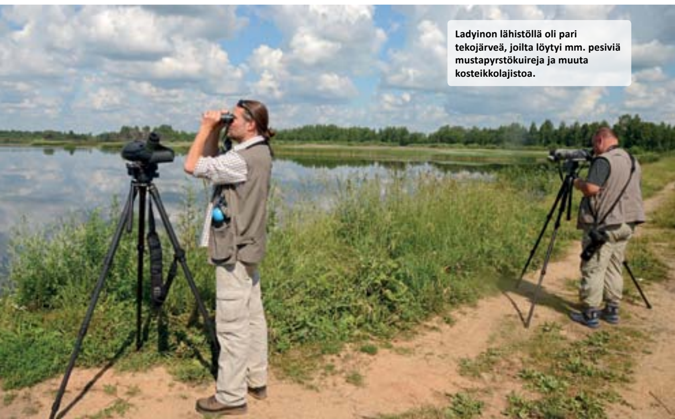
Ladyinon lähistöllä oli pari tekojärveä, joilta löytyi mm. pesiviä mustapyrstökuireja ja muuta kosteikkolajistoa.

Ilaksi suuntasimme järven ete-läreunalle Starorusskiy rayonin kaupunkiin ja sieltä edelleen yötä myöten pieneen Vzvatn kylään yölaulajaretkelyn merkeissä. Sirkkalintujen, viitakertusten ja