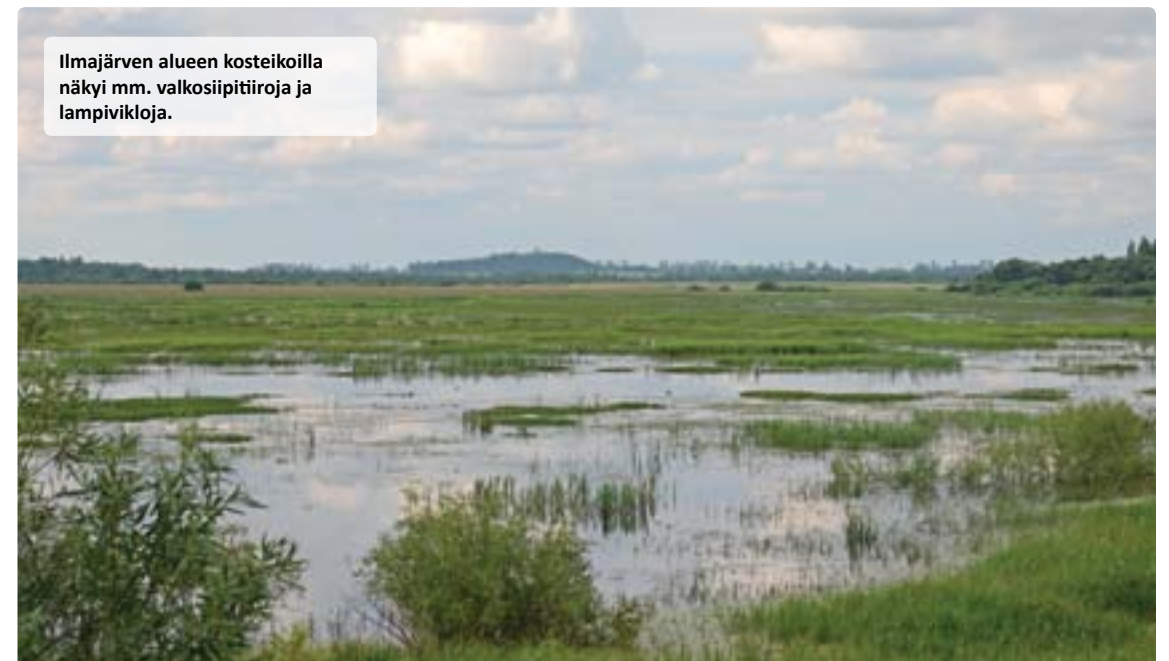
Ilmajärven alueen kosteikoilla näkyi mm. valkosiipitiiraja lampivikloja.