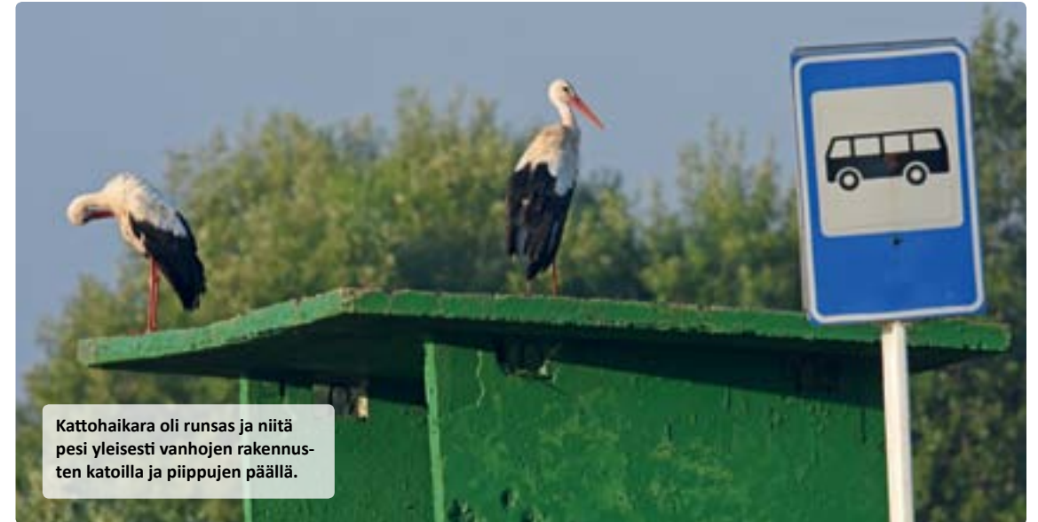
Kattohaikara oli runsas ja niitä pesi yleisesti vanhojen rakennus-ten katoilla ja piippujen päällä.

Veliki Novgorodin historiallinen kaupunki sijaitsee linnuntietä noin 300 km Vaalimaalta, Suo-men rajalta kaakkoon. Autolla matkaa kertyy hieman yli 400 km. Novgorodin tekee lintuhar-rastajalle kiinnostavaksi Ilmajärvi (Ilmen) kosteikkoineen ja vil-