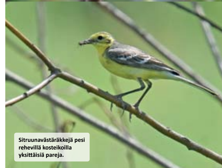
Sitruunavästäräkkejä pesi rehevillä kosteikoilla yksittäisiä pareja.