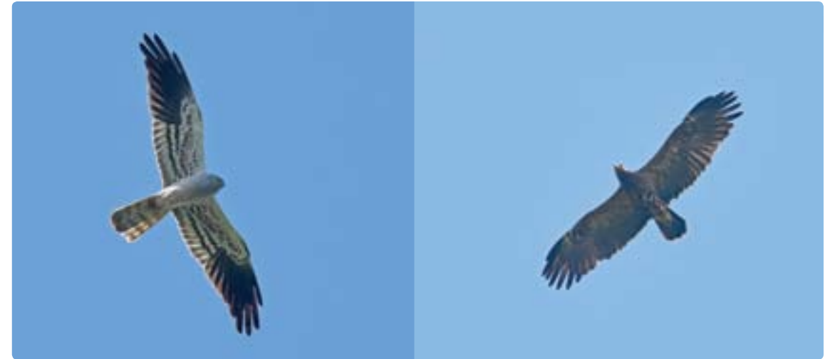
Niittysuohaukkoja ja pikkukiljukotkia nähtiin harvakseltaan viljelysseuduilla.

ka on heinittynyt ja pusikoitunut, ja siten tarjoaa erinomaista elinympäristöä yölaulajille ja avointen tai puoliavointen maastojen linnuille. Viitasirkkalintu, viitakerttunen ja ruisräkkä olivat runsaita, ja pikkukultarintoja laskettiin aamun kuluessa yli 30. Pesintä saatiin varmistettua pariinkin atlasruutuun poikasiaan ruokkivien emojen ansiosta.