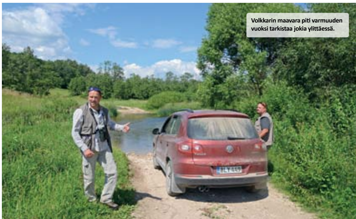
Volkkarin maavara piti varmuuden vuoksi tarkistaa jokia ylittäessä.

Arkazhin alueelle, joka sijaitsee Novgorodista lounaaseen, Ilmajärven luoteis-länsikulmalla. Täällä kolusimme erinäisiä kosteikkoja ja maaseutua. Sitruunavästäräkkipoike nähtiin ja jo totuttuun tapaan mm. mustatiiroja, viitataisia, pähkinänakkeleita, pari haarahaukkaa ja niin edelleen. Aamun päätteeksi