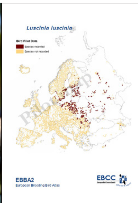
Pilotní mapy hnízdního rozšíření slavíka tmavého ( Luscinia luscinia ).